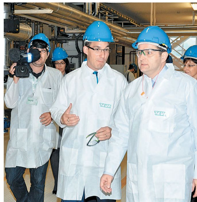
Az automatizált üzembn ritka, hogy ennyien lennének

A Teva több mint 20 éves működése alatt mintegy 350 milliárd forintot ruházott be Magyarországon, megteremtve üzeimben (Debrecenben, Gödöllőn és Sajnábabonyban) a világszínvonalú gyógyszergyártást, és munkát adva közel 3500 embernek.